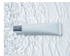
デアイワスペシャルクリーム

販売名：Deaiwo クールモンスター UV ジェル 内容量：200ml ￥4,950(￥4,500+10%税)