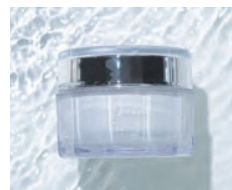
デアイラブイオウエキクリーム